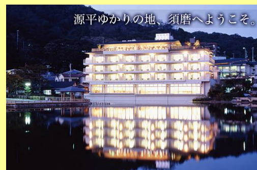
源平ゆかりの地、須磨へようこそ。

〒654-0071 兵庫県神戸市須磨区須磨寺町3-5-18 TEL: 078-731-4351 FAX: 078-731-2475