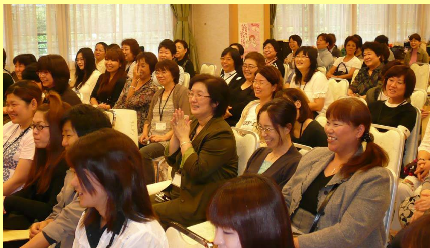
「笑いあり、涙あり。いつも楽しい女性集会」昨年の女性集会より

厚労省通知「看護師等の『雇用の質』向上のためのとりくみ」について 医療・看護を語る会 働きながら子育てを考える会 職場団交の進め方・申し入れ書 など… 2011年秋のたたかひの具体化をはかります