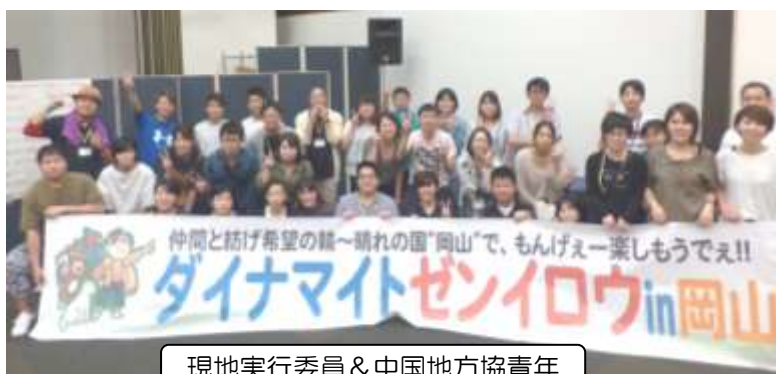
現地実行委員 &amp; 中国地方協青年