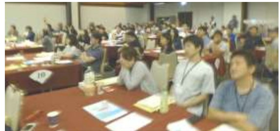
エンドロール鑑賞中

今回参加していただいた青年のみなさんへ 全国からたくさんの青年が集まり、「ダイナマイト・ゼンイロウ in 岡山」を成功させることができました。