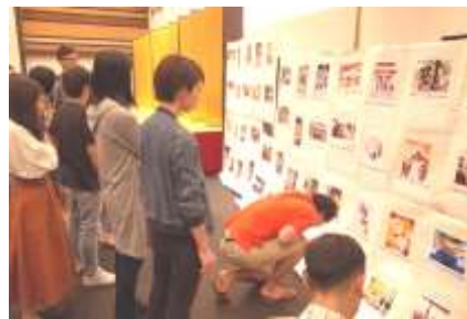
フォトコンテスト投票

2日目の夕食交流会はフォトコンテスト投票と表彰式！ 班で協力して撮影した写真をみて、投票しました。上位のチームには中国地方 5 県から集めた景品を贈呈しました！ 岡山の「黄ニラ醤油」や山口の「ふぐ雑炊のセット」などの景品が送られました☆