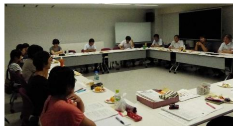
新全医労会館で開催。美味しいお菓子を囲みながら。

9月18～19日、新全医労会館にて2013年度第1回の地方協女性部長会議を開催しました。今年度新しく女性部長になった方3人も含めて、にぎやかに、ためになる話が展開され、「新夜勤改善・大幅増員署名」のとりくみと「女性集会」の成功、「女性部・増員交渉」の要求前進を誓い合いました。