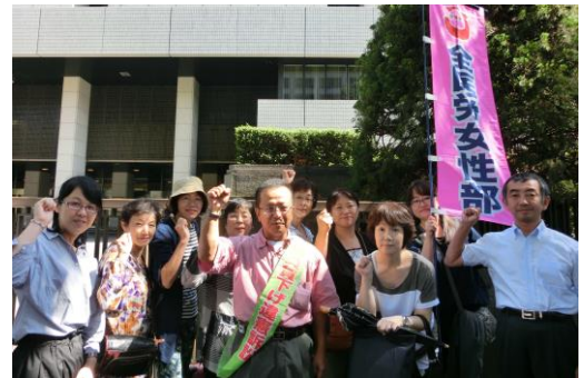
会議終了後、国公賃下げ違憲訴訟地裁前行動に参加。