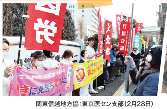
関東信越地方協:東京医セシ支部(2月28日)