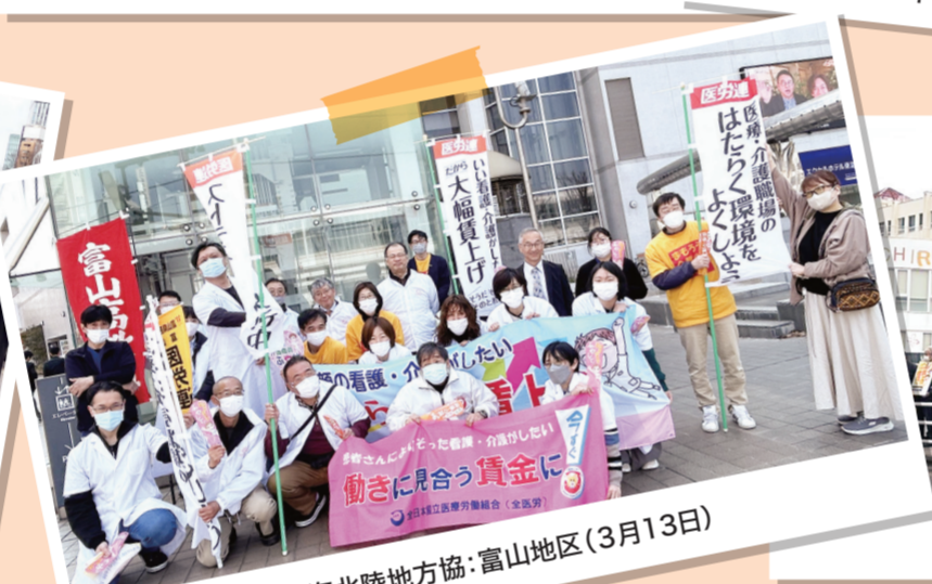
東海北陸地方協:富山地区(3月13日)