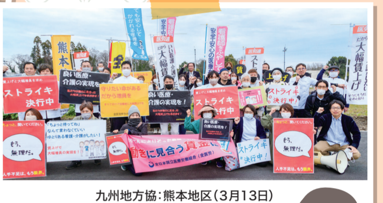
九州地方協:熊本地区(3月13日)