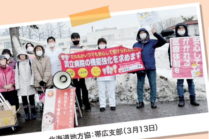
北海道地方協:帯広支部(3月13日)