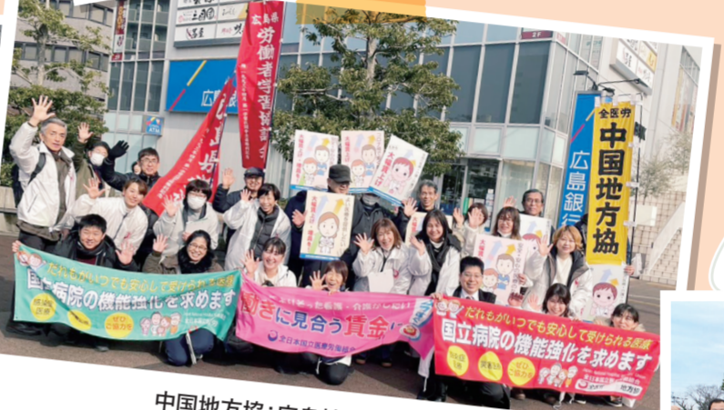
中国地方協:広島地区(3月13日)