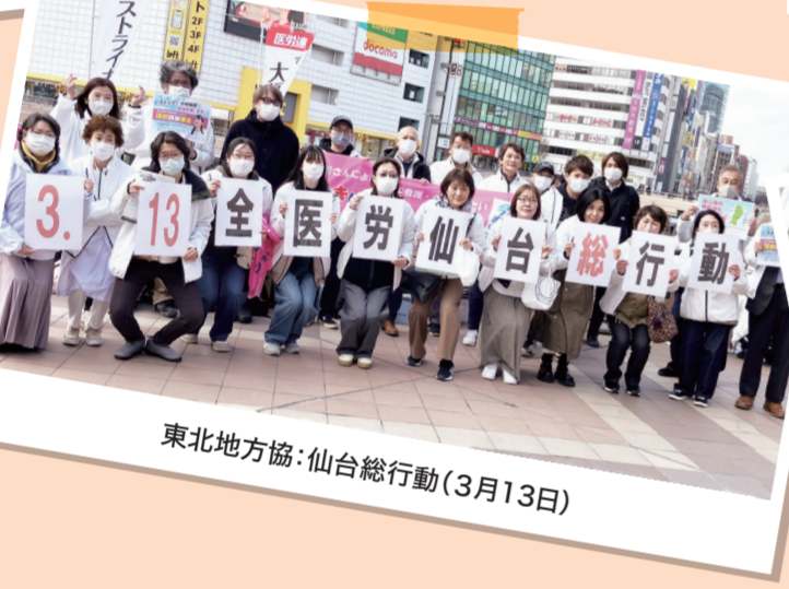
東北地方協:仙台総行(3月13日)