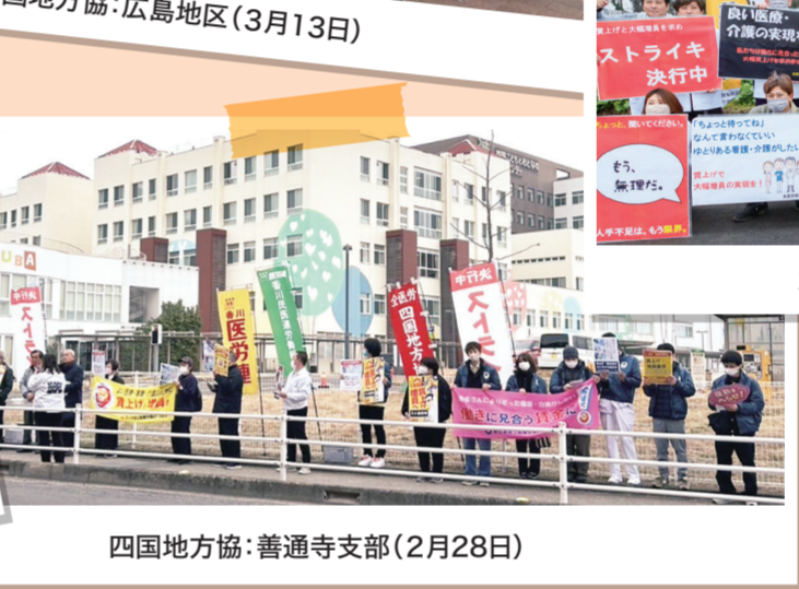
四国地方協:善通寺支部(2月28日)